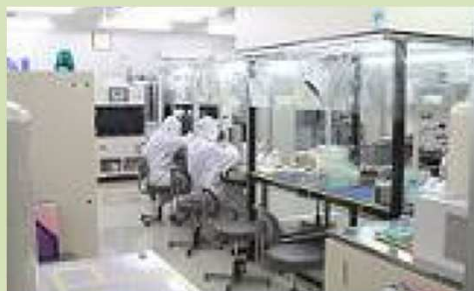
TCXO Oscillator (10 ~ 52MHz)

生産キャパ 1612: 1Mpcs/M, 2016/2520/3225: 15Mpcs/M 4025/5032: 1Mpcs/M, 6035/7050: 3Mpcs/M